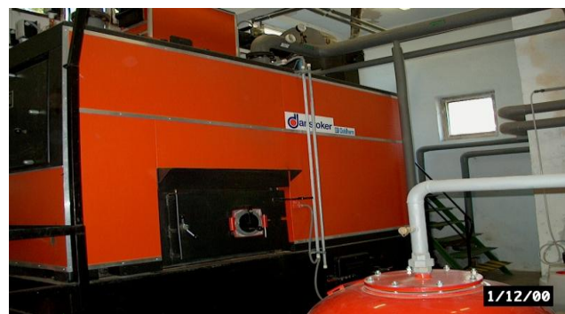
Technologické zariadenie kotolne po rekonštrukcii Technological mechanism after the boiler reconstruction

A boiler reconstruction within the exchange of coal to wooden lap – pellets was realized in the same time as realization of the pilot project. Heat distribution pipes were changed as well as the zone regulation has been installed.