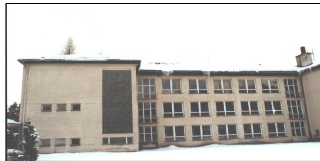
Pohľad na severovýchodnú fasádu ZŠ Klokočov v pôvodnom stave View of the outer southwest wall of the elementary school Klokočov in the original shape

“The pilot project to upgrade a consolidated elementary school” was a pilot project aimed at preparing database of elementary schools and other state buildings, to define conditions of consolidated elementary schools and other state buildings as well as was made upgrading design of the chosen elementary schools within the VTP 0402840512. The main purpose of the pilot project was shown out necessity to upgrade school buildings. School buildings compose 54,9 % of all buildings and 62,5 % of total capacity non-residential non-production buildings within the state belongings. Elementary school buildings and their accessory equipments compile 20,3 % of total capacity number and 29,1 % of volume capacity. The six main primary conditions are able to fulfil by upgrading of elementary schools. The school building chosen for the project, focused on masonry elementary schools built up at sixtieth years, was located at Klokočov, district Čadca. The part of pilot project focused on reduction of heat consumption for space heating was conducted from the end of 2000 to 2001.