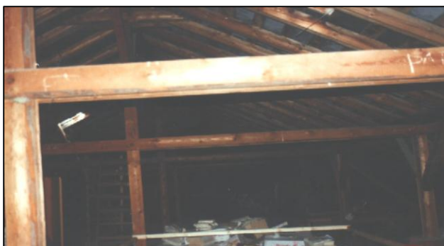
Pohľad na krovovú konštrukciu v šikmej streche školy View of the slope roof structure timber

Výpočet potreby tepla na vykurovanie sa vykonal v čase návrhu obnovy podľa STN 73 0549/Z1. Potreba tepla pre budovu školy predstavovala 54,32 kWh/(m 3 .rok), čo je vyššie ako normatívna hodnota. Obalovými stavebnými konštrukciami dochádza ku tepelným stratám. Najvyšší podiel ochladzovaných plôch na budove školy majú obvodový plášť 34%, strecha 24%, podlaha na teréne 24% a otvorové konštrukcie 18%. Z výpočtov vyplýva, že priemerný súčiniteľ prechodu tepla konštrukcií budovy školy U_m = 1,277 \text{ W}/(\text{m}^2.\text{K}) . Z dôvodu nespĺnenia energetického kritéria a tepelnoizolačných vlastností bolo navrhnuté zateplenie obvodového plášťa, stropu posledného podlažia pod nevykurovaným strešným priestorom a výmena otvorových konštrukcií.