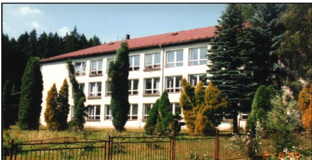
Pohľad na juhozápadnú fasádu ZŠ Klokočov v pôvodnom stave View of the elementary school Klokočov outer southwest wall in the original shape

Základná škola sa nachádza v mierne svahovitom teréne v časti Klokočov-Klín. Komplex školy tvoria objekty školy, telocvičňa a družiny. Škola bola odovzdaná do užívania v roku 1962.