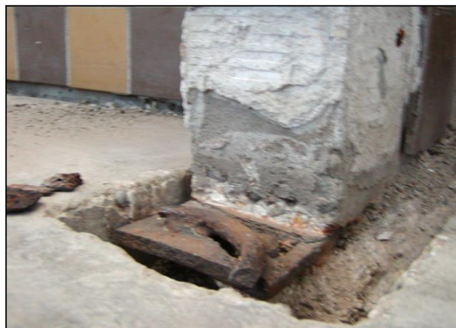
▲ Nesprávne zhotovené stredové kotvenie zábradlia k lodžiovej doske Incorrectly made central anchoring of railing to the loggia plate

emerging transfer of a deformation of loggia walls by the “blocking mechanism” (mainly on the highest floors) in the outer wall.