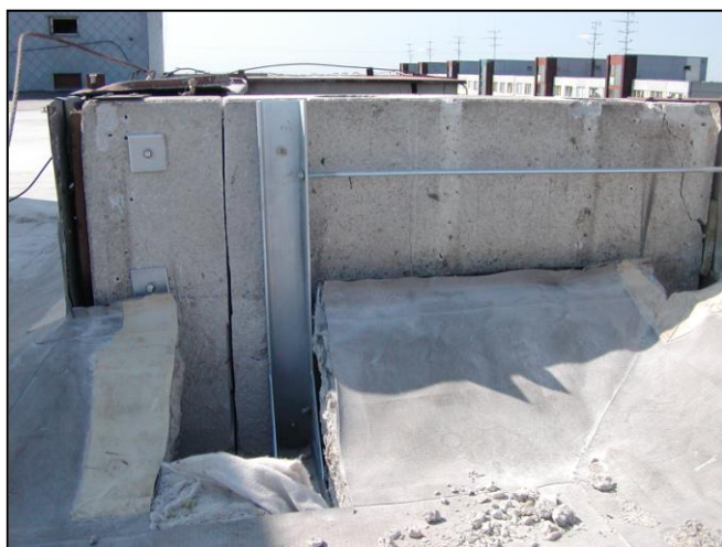
Zabezpečenie dilatácie atiky v nároží Provision for dilation of attics at the corner