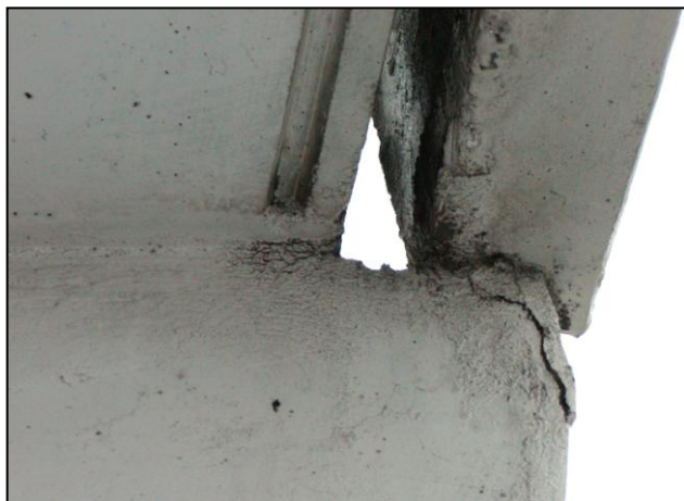
▲ Poruchy v uložení zábradlia na konzolu lodžiovej steny Faults in mounting of railing to the console of loggia wall

zvýšeným miestnym tlakom vznikajúcim prenosom deformácie lodžiových stien „blokovacím mechanizmom“ (najmä v najvyšších podlažiach) do obvodového plášťa.