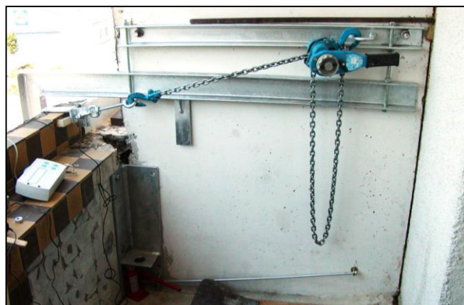
Upevnenie zábradlia s posunmi Fixing of railing with shifts