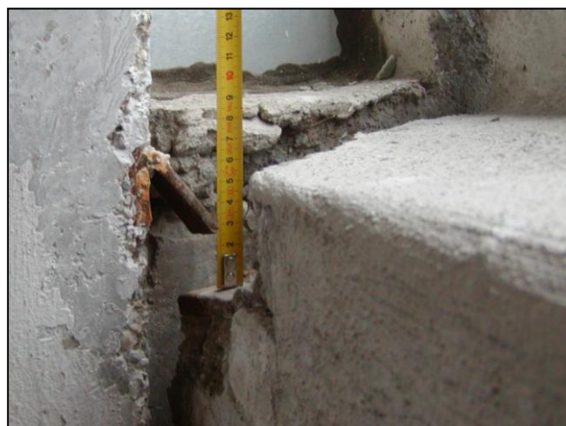
Nesprávne zhotovené horné kotvenie zábradlia Incorrectly made upper anchoring of railing

The side walls of the loggias are constructed of reinforced concrete panels with a thickness of 150 mm. According to the sample project they are anchored to the bearing structure of the building to allow for vertical and horizontal deformation in a direction parallel with the façade, which are caused by the temperature difference of the above-mentioned structures. Of the 132 loggias in total, 70 are glassed in, i.e. 53 %. The structure and form of the glazing of the loggias differ.