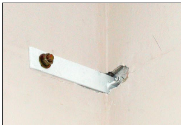
▲ Dodatočné prikotvenie lodží (zo strany bytu) Subsequent anchoring of loggias (from the apartment side)