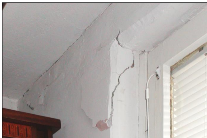
Poruchy v obvodovom plášti P1.15 v oblasti ukotvenia K33 a K34 Faults in mounting of loggias to the console of loggia wall

Medzi lodžiou a bytovým domom (najmä v oblasti kotvenia K33 ) je „blokovací mechanizmus“, ktorý spôsobuje, že v ukotvení K33 vytvára vzájomné silové pôsobenie značnej veľkosti. Hlavnými prvkami blokovacieho mechanizmu sú nesprávne zvary, zaliate medzery medzi lodžiovými konštrukciami a obvodovým plášťom bytového domu a pevné uloženie ukotvenia K33 . Existencia blokovacieho mechanizmu sa potvrdila celoročnými meraniami vzájomných posunov dom - lodžia. Rozhodujúce sú zvislé sily ktoré rastú s výškou vyšetrovaného miesta nad terénom a spôsobujú deformácie kotiev K33 . Keďže ukotvenia K33 sú súčasne konzolami na uloženie spínaných pórobetónových obvodových panelov, uvedené deformácie negatívne ovplyvňujú stav napätosti v týchto paneloch. Prejavujú sa trhlinami až vypadávaním hmoty pórobetónu zo spínaných panelov obvodového plášťa.