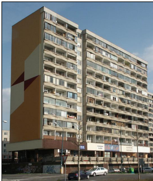
Pohľad na západné priečelie s predsadenými lodžiami View of western front with protruding loggias

Bočné steny lodžií tvoria nosné železobetónové panely hrúbky 150 mm. Podľa typového projektu sú ukotvené k nosnej konštrukcii domu tak, aby umožňovali zvislé a vodorovné deformácie v smere rovnobežnom s priečelím vyvolané rozdielom teploty uvedených konštrukcií. Z celkového počtu 132 lodžií je zasklenených 70, čo je 53 %. Konštrukcia a tvar zasklenia lodžií sú rôzne.